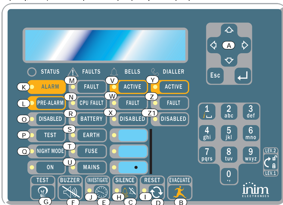
Figure 2 - Πρόσοψη επαναλήπτη

Αυτός ο πίνακας έχει την δυνατότητα να δεχθεί έως 4 επαναλήπτες. Οι επαναλήπτες αποδίδουν όλες τις πληροφορίες που δίνει ο πίνακας και επιπλέον επιτυρέπουν εντολές επιπέδου 1 και 2 (Κατάσταση ενεργών συμβάντων, Reset, σίγαση, κλπ.). Δεν επιτρέπουν πρόσβαση στο κύριο μενού.